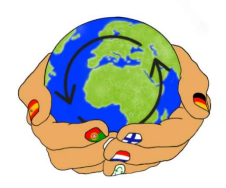
Committed to sustainability Erasmus +