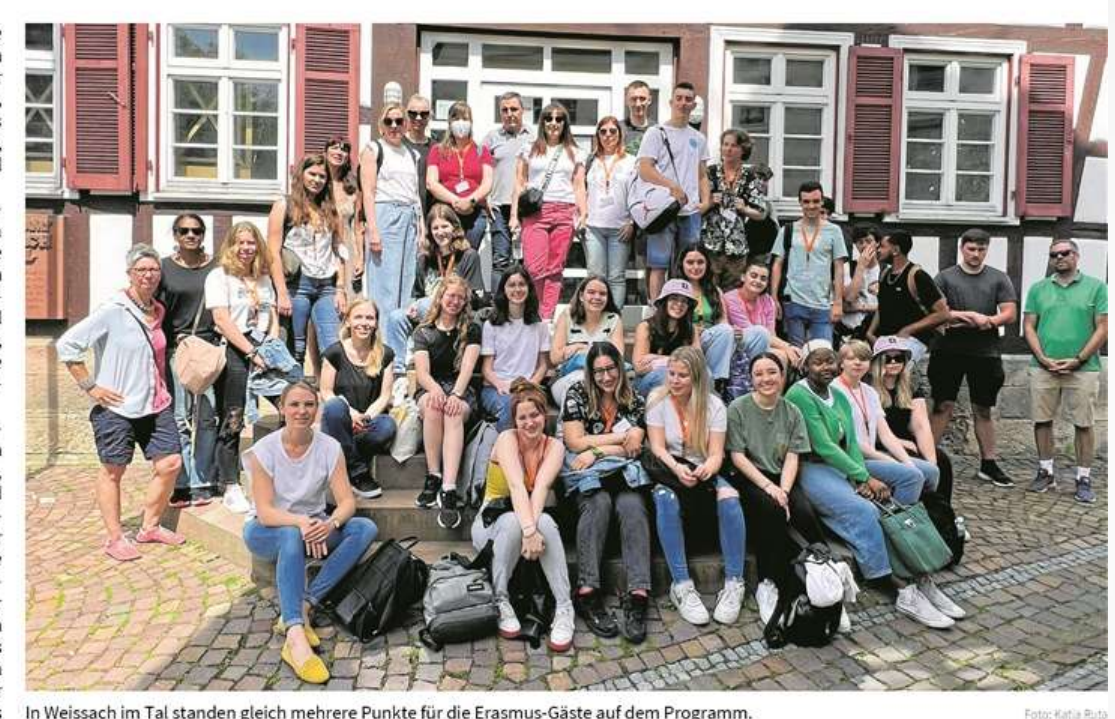
In Weissach im Tal standen gleich mehrere Punkte für die Erasmus-Gäste auf dem Programm.

Der Höhepunkt für viele war am Mittwoch, als im Zuge des Themas "Nachhaltige Entwicklung in der Autoindustrie" das Mercedes-Benz-Museum in Bad Cannstatt be- bot viele unvergessliche Momente zusamsucht wurde. Und natürlich die freie Zeit in men mit dem außerplanmäßigen Ausflug Stuttgart. Der Besuch an der Universität an den Waldsee, wo ein Abschied für die